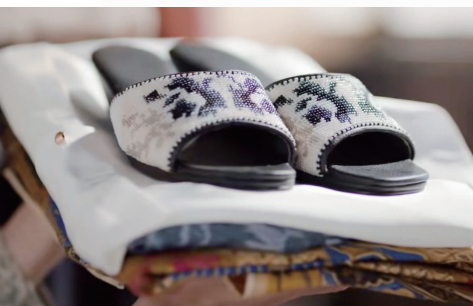
绣鞋 电视剧《小娘惹》截图