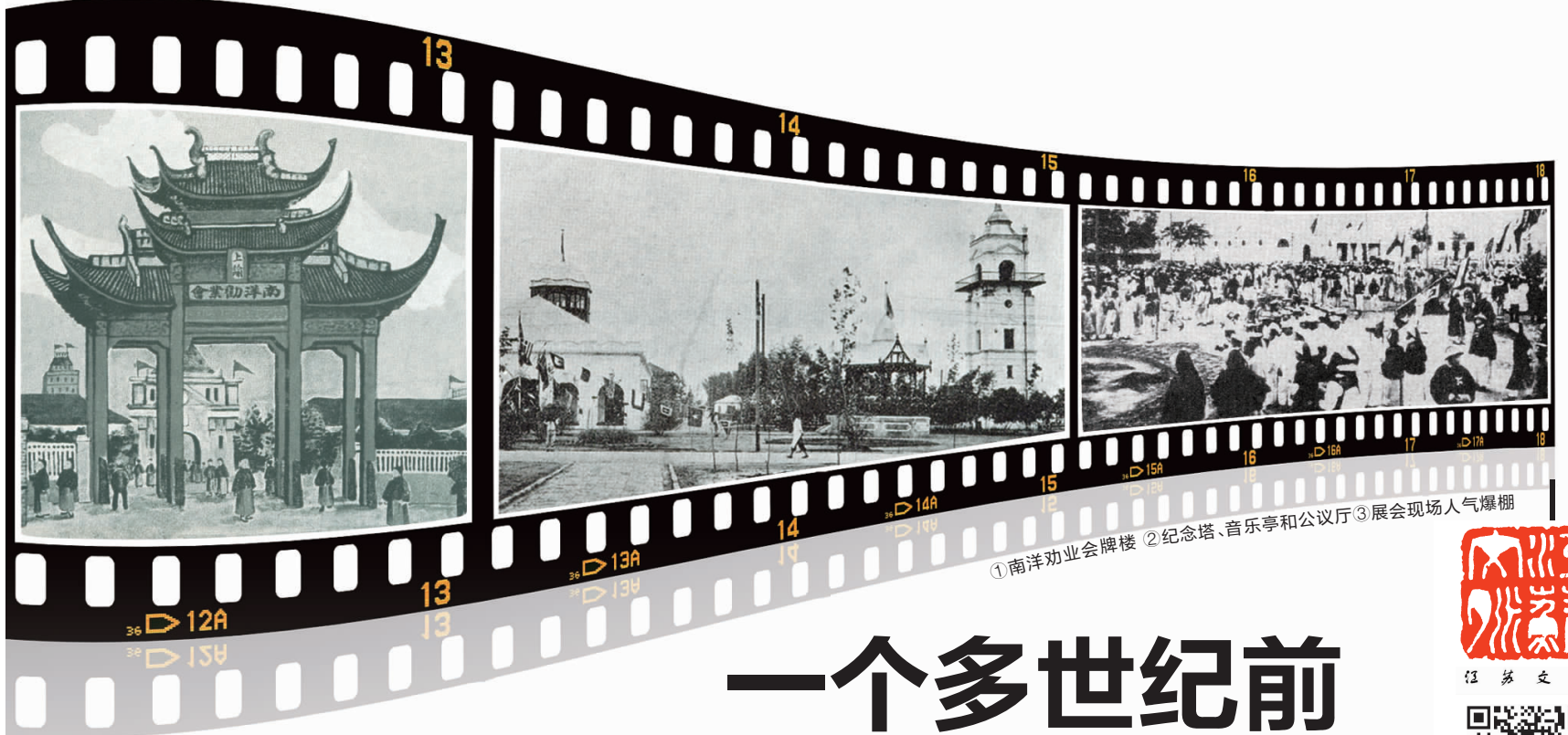
①南洋劝业会牌楼 ②纪念塔、音乐亭和公议厅 ③展会现场人气爆棚