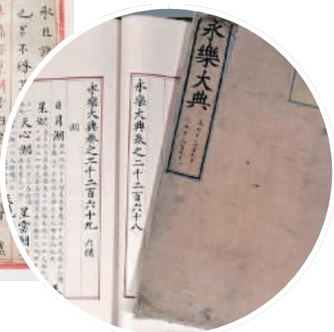
拍卖图录中的《永乐大典》抄本图片