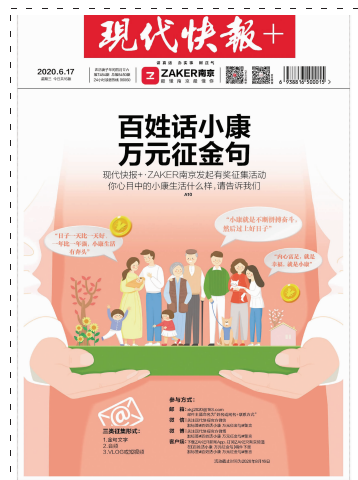
6月17日,现代快报+·ZAKER南京发起小康金句征集活动