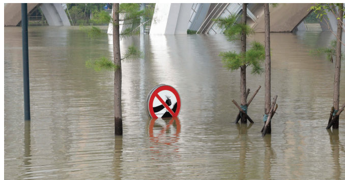
南京三汊河口是外秦淮河入江口,上涨江水淹没了河道两侧的亲水平台和步道,附近路段已经封堵

快报讯(记者 卢海燕)7月8日,农历十八,现代快报记者获悉,上午11时左右,天文大潮经过南京,长江南京站水位上涨,达到今年入汛以来的最高水位9.62米,超警戒水位0.92米。