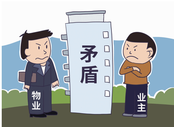
去年南京物业管理投诉位列民生热点问题投诉第一位