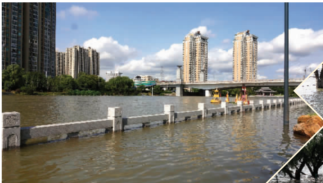
南京三汊河水闸段附近水位上涨明显