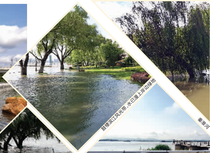
鼓楼滨江风光带,水已漫上岸边绿地