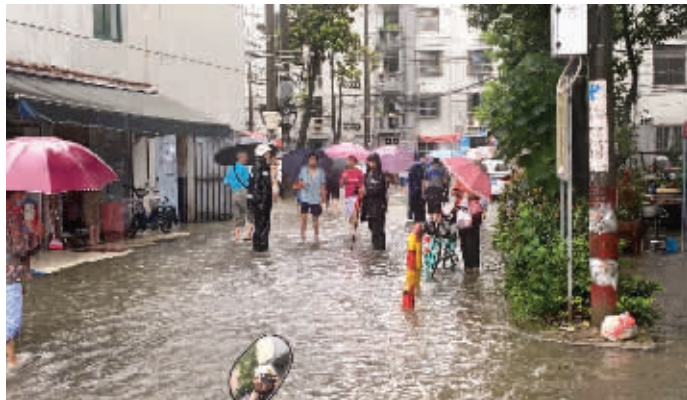
无锡中桥二村积水,城管协助排涝