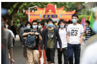
南京市第九中学考点看考场的考生

切记:不要把手表、手机以及具有发送或者接收信息功能的设备和电子存储记忆的录放设备带进考场,开考后,无论是否使用,一律按作弊处理。也不要佩戴手表参加考试(考场已设置时钟,为考生作答提供时间参考),否则按照违规处理。