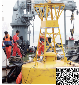
“出逃”的锚浮标筒被找到 扫码看视频

快报讯(通讯员 余祥 杨大清 记者 顾潇)7月2日上午,长江仪征取水口水域,一只锚浮标筒“出逃”。长航公安局南京分局仪征派出所及南京航道部门接到报警后赶赴现场,发现仪化2号锚浮标筒缺失,随后在下游1公里处的南京紫金山船厂水域找到。现代快报记者了解到,锚浮标筒一只大概5吨重,一旦撞上航行船只,后果不堪设想。据悉,南京航道部门南京宁道标403船舶接到消息后赶到现场,将仪化2号锚浮标筒拖回长江仪征取水口水域进行固定,并将断裂的缆绳连接上,消除隐患。