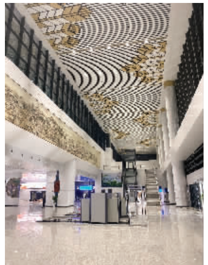
常熟站芦苇飘荡的站房设计