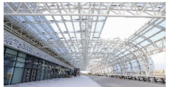
南通西站送客平台