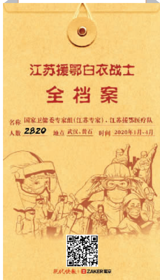
扫码看《全档案|致敬2820! 致敬江苏援鄂白衣战士!》H5