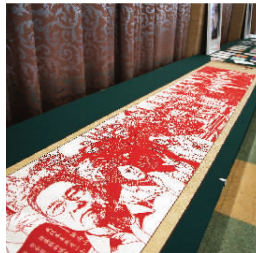
抗疫主题的剪纸作品