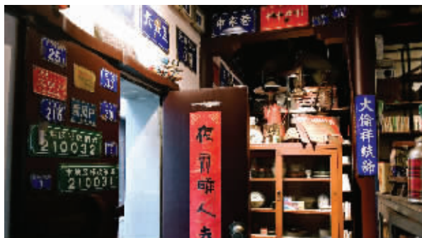
曾经熟悉的门牌号