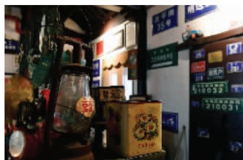
风扇、门牌号等旧物