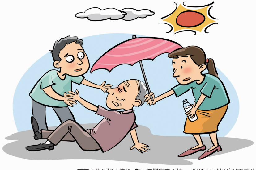
南京立法为好人撑腰,老人摔倒请安心扶(图文无关)