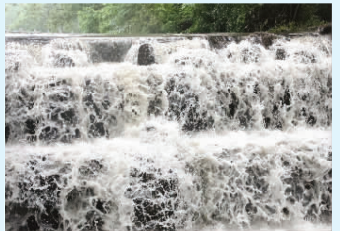
6月14日早晨,南京下了一场大雨。在东郊景区霹雳桥下的出水口,出现了罕见的一幕。雨水顺着山体、石阶奔流直下形成了“瀑布”奇观。