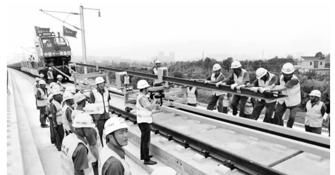
铺轨现场

快报讯(通讯员 胡晓炜 束为 记者 刘伟娟)6月12日,江苏省东台市盐通高铁东台站施工现场,铺轨机牵引着一组500米长钢轨平稳地落在无砟道床上。