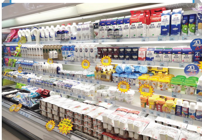
超市冷藏柜中纸质包装饮品占了“半壁江山”