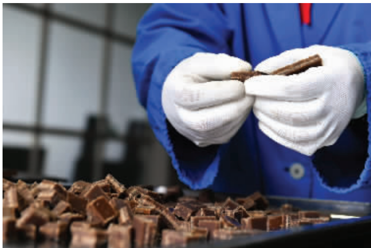
江苏省非物质文化遗产代表性项目——梨膏糖 快报资料图片

你想去世界文化遗产、全国重点文物保护单位洪泽湖大堤吹吹风吗？你想在家看非遗展，购买精美的江苏非遗文创品吗……6月13日是2020年“文化和自然遗产日”。6月8日，现代快报记者从江苏省文化和旅游厅了解到，今年江苏省“文化和自然遗产日”系列活动，分为文博活动和非遗活动两大板块。文博方面，全省将组织百余场活动；非遗方面，全省各设区市将举办260多场非遗宣传展示活动。