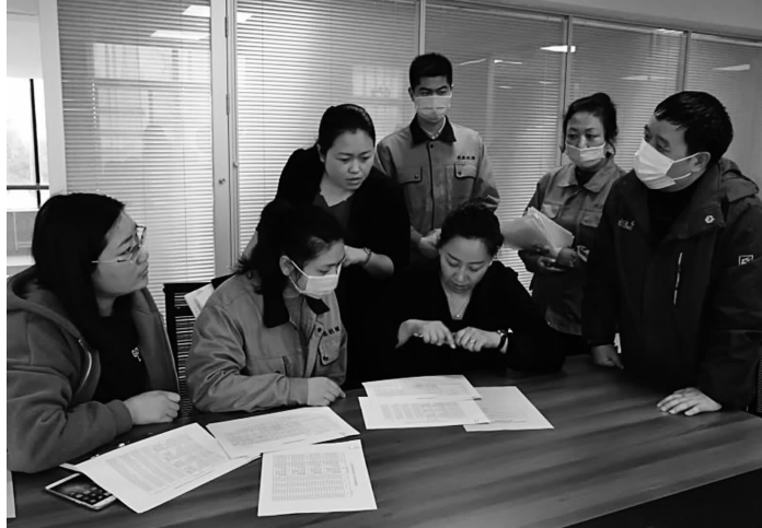
研发人员深入企业现场检查指导

近年来，为促进企业创新发展，海州区积极落实扶持企业科技创新的各级各类政策。对与研发经费直接相关的创新项目申报、产学研合作、研发成果奖励，间接相关的研发机构建设、创新人才引进等给予更加全面更大力度的支持。今年以来，为73家企业兑付资金1163万元，为10家企业争取“苏科贷”资金2720万元。