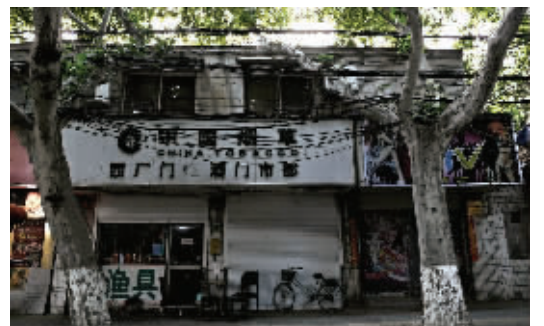
西厂门的街巷极具年代感，如同老电影的场景一般