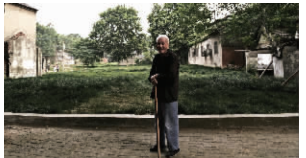
老人是这里绝对的“主角”