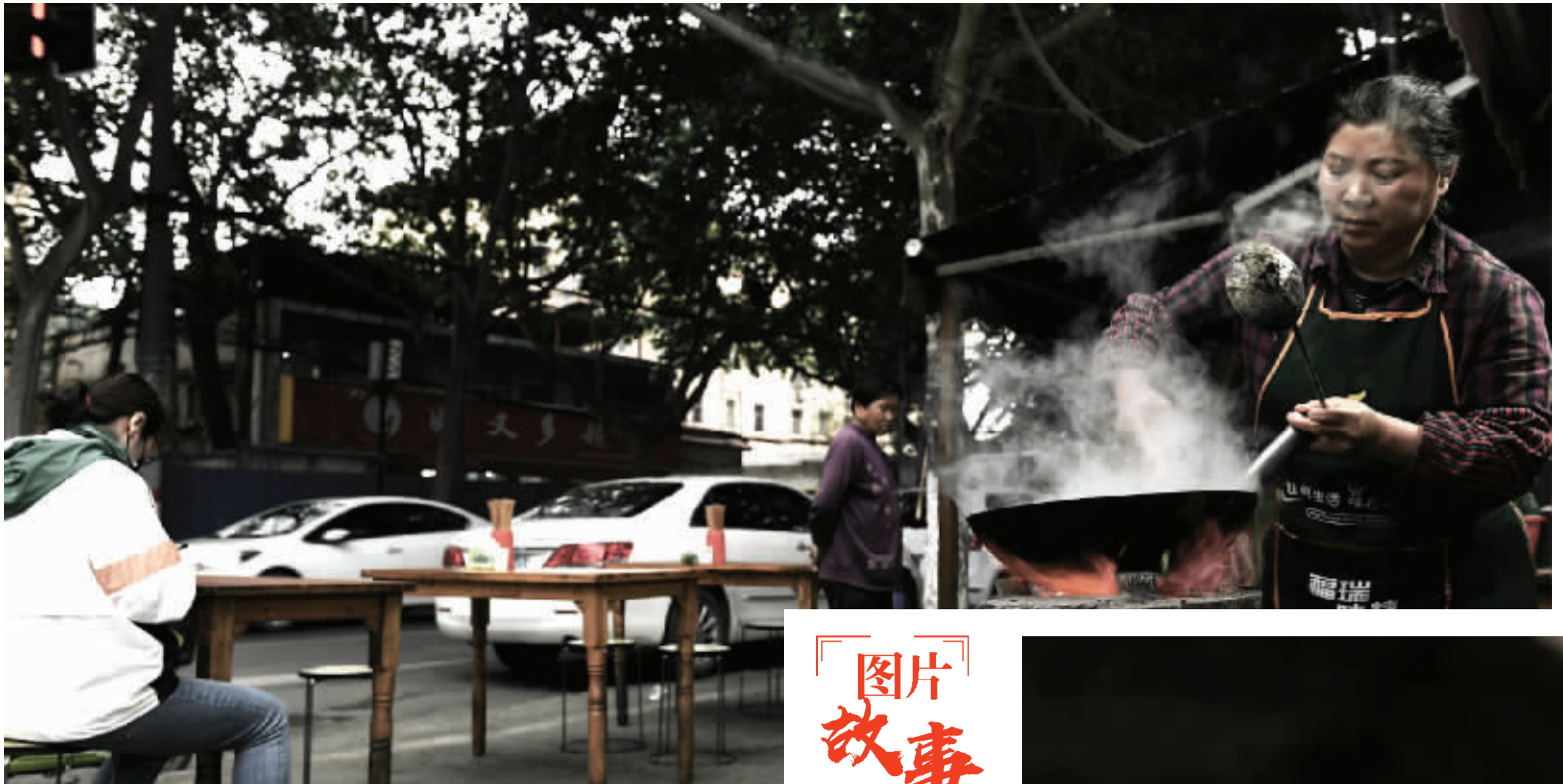
小汤面是潘姐从小吃到的味道