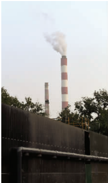
随处可见的大烟囱见证着过去的繁华

行走在南京大厂西厂门的街巷，一下子就走进了一部极具年代感的老电影里。爬坡的老街，旧式的发廊，褪了色的店铺，让时光在这里按下了暂停键。