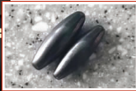
▲医生从涵涵体内取出的磁力珠 ▲6个磁力珠在东东体内