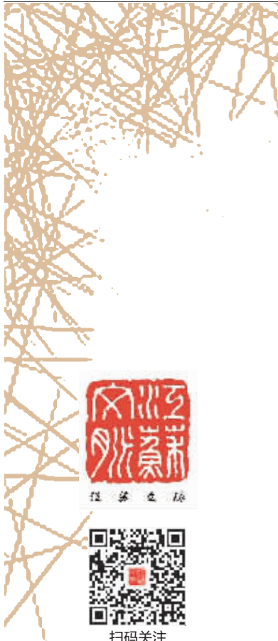
扫码关注 江苏文脉公众号