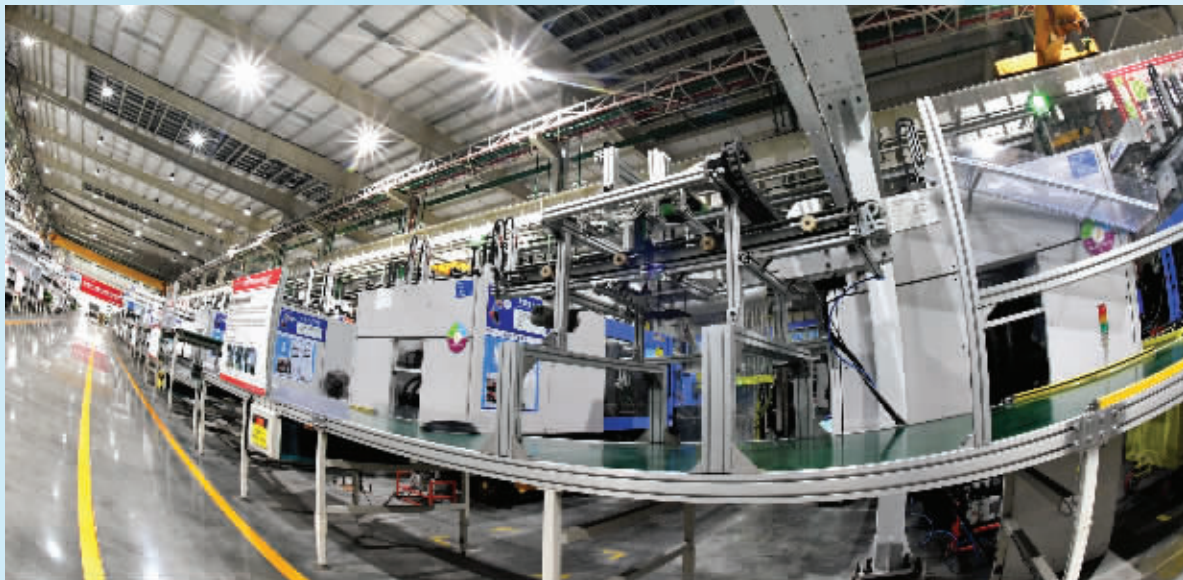
大项目纷纷落户宿迁