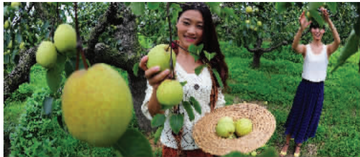
特色农业让村民走上致富路

小康不小康,关键看老乡。近年来,宿迁一直深入践行以人民为中心的发展思想,聚焦群众最关心最直接最现实最想解决的问题,拿出实际行动一件一件解决好,确保高水平全面建成小康社会经得起实践、人民、历史的检验。