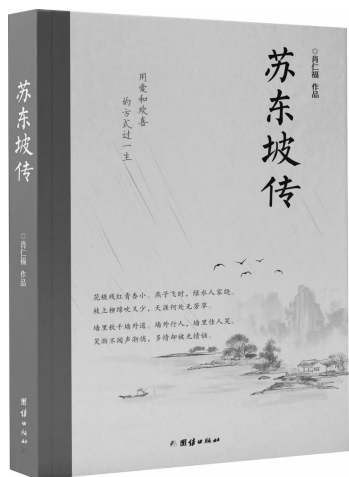
《苏东坡传》 肖仁福 团结出版社 2020年3月

都说东坡是全才——诗人、词家、散文家、经学家、史学家、书法家、画家、政治家、建筑家、水利家、美食家，不一而足。肖仁福先生却以其新著《苏东坡传》告诉读者，东坡众多绝伦才艺，不过是他人人生大树上的繁花，从根子上说，东坡其实是天下第一“好人”“仁人”和“乐人”，也正因为汇齐了这三者，东坡才成就了世人所乐所爱所知之东坡，盛名历百千年不衰。