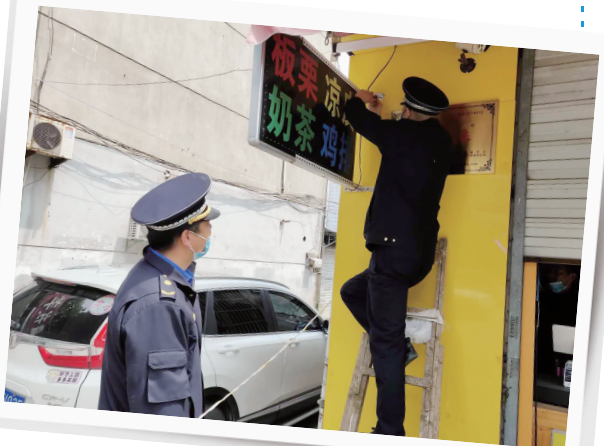
拆除违规户外广告