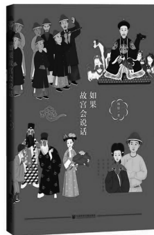
《如果故宫会说话》 杨原 社会科学文献出版社 2020年4月

北京故宫，前身是紫禁城，迄今已经六百年。明清两朝皇帝办公和居住的皇宫，在政治、历史和文化上都有特殊的地位。如果故宫会说话，她会告诉我们什么样的故事呢？