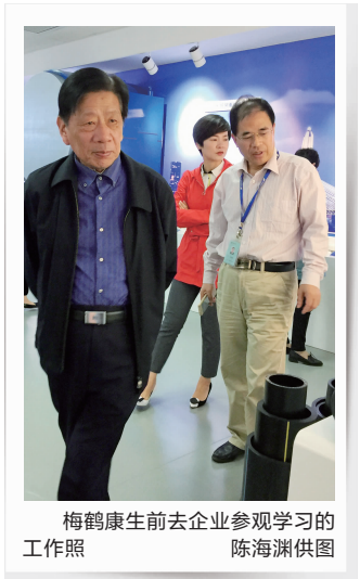
梅鹤康生前去企业参观学习的工作照