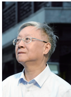
莫砺锋 南京大学文学院教授、《国学文选》主编

莫砺锋表示，国学发展了几千年，靠一部书自然无法穷尽所有，他们是想把最重要的一些基本方面介绍给大家。在他看来，12个章节更像是12个主题词，是古人思考问题时最关注的12个方面。