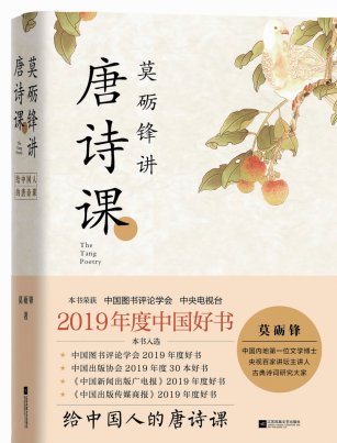
《莫砺锋讲唐诗课》莫砺锋著 江苏凤凰文艺出版社2019年6月