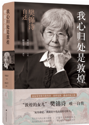
《我心归处是敦煌：樊锦诗自述》樊锦诗口述/顾春芳撰写 译林出版社2019年10月