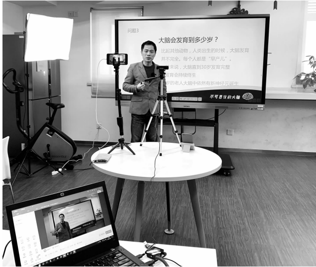
疫情期间,华东师范大学出版社推出“好奇哥哥”系列网络直播科普讲座

“出版社的图书编辑将会逐渐向主播发展吗？”4月8日下午，译林出版社社长葛庆文在线上直播平台“新形势下的译林出版”的分享时，一位出版专业的同学抛出了这样的问题。近年来，数字化出版就是大势所趋，疫情之下，口罩后面的编辑们更是频繁携手数字化出版和短视频、直播等线上营销的新兴手段出现在读者们面前。