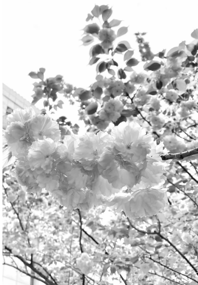
气温回暖,晚樱盛开