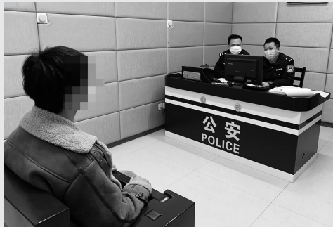
审讯现场