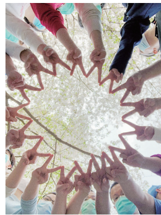
苏州市立医院援湖北医疗队合影

查阅相关文献,对接管病区里的重症患者护理工作方面做了归纳小结,包括职业防护、工作流程、各班职责、特色护理以及其他亮点等。我们不断总结学习,摸索出有循证依据的特色护理,在学习中进步,也相信未来的工作中我们可以做得越来越好。此次的抗疫让我和队友之间建立了珍贵的友谊,也让我在各方面得到了充分的锻炼和成长,使我感受到前所未有的充实和快乐。