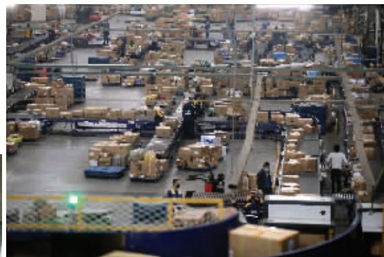
德邦快递武汉转运中心全面复工