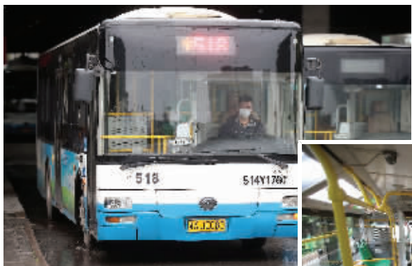
公交车重现武汉街头