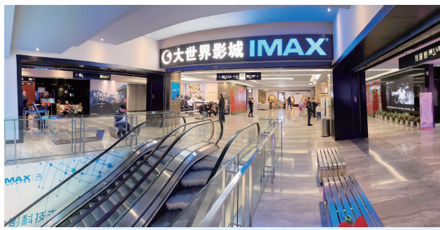
影院 即将恢 复营业