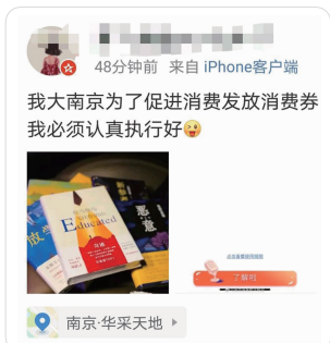
有关消费券的信息,朋友圈刷屏