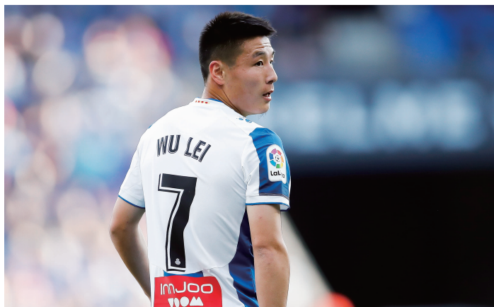
效力于西班牙人的武磊

这周西班牙也通过关闭公共场所、宣布封城、劝导民众尽量待在家中等一系列措施来控制疫情蔓延,看到很多球迷很关心我和家人的生