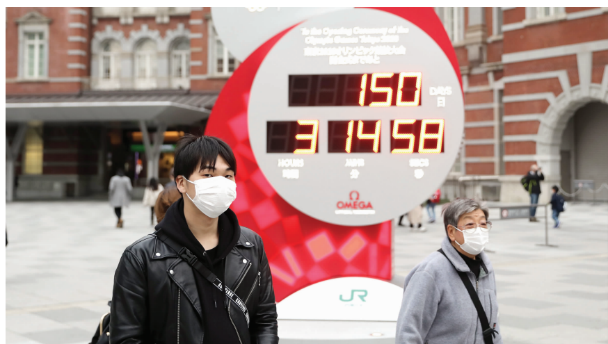
2月25日,在日本东京,行人戴口罩经过显示东京奥运会倒计时的电子屏

庞德的言论是敲响警钟还是杞人忧天?在全球面临新冠肺炎疫情暴发风险、多个国家多项体育赛事推迟的情况下,东京奥运会能否如期举办?而东京奥运会如果最终被取消,谁又将受伤最深?