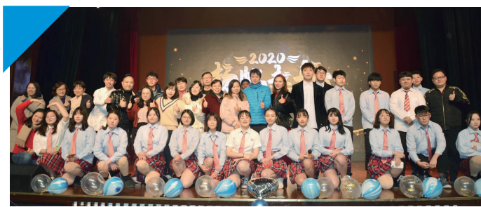
迎新外语文化比赛