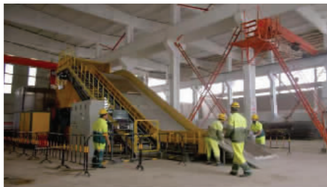
全市首个大件垃圾分拣处置中心,占地面积为1880平方米