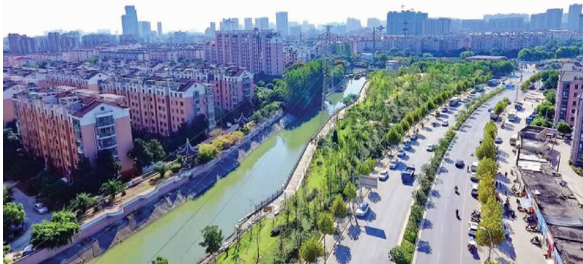
广益街道桐桥港路广益星苑东侧空地,原来是偷倒垃圾的重灾区,已被改建为休闲、健身、娱乐的公共小游园