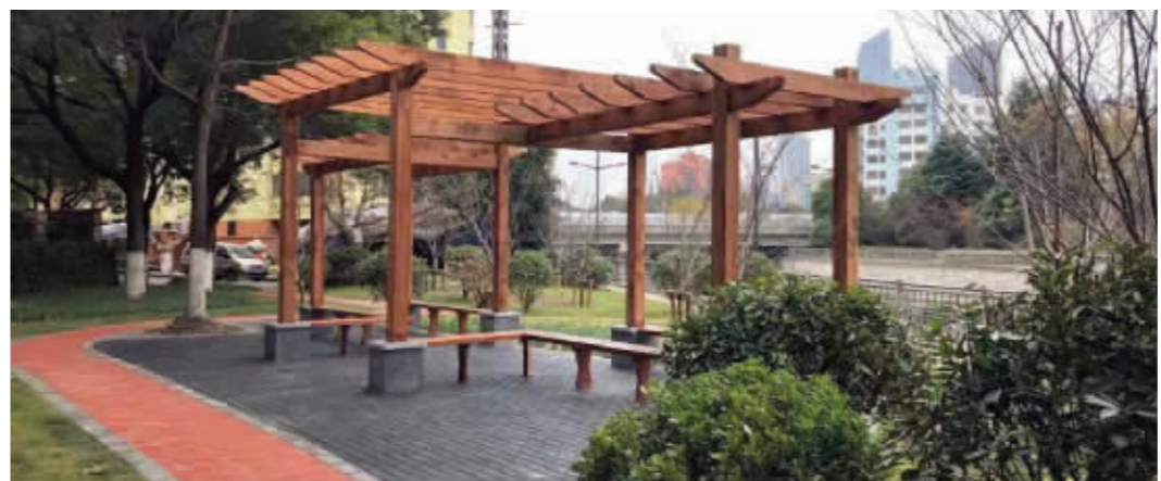
人民东路游园品质提升

业河西侧沿河10米内环境整治后腾出的场地,在广泛听取周边居民意见基础上,策划并建设爱国主题综合文化广场,围绕“弘扬爱国主题精神、凝聚社区治理合力”为核心。场地分为五大区域:北部为百姓文化舞台区,中部为错时停车导区,南部为爱国升旗广场区,东侧为醉美樱花景观区,西侧为爱国文化走廊区。广场集爱国主义教育宣传、节庆主题活动、党建工作创新交流、社区治理成果展示、党员群众文体活动、居民休闲娱乐健身、停车秩序错时疏导等多功能于一体,改善了周边居民生活配套设施,成为培育和践行社会主义核心价值观、凝聚精气强基固本的崭新阵地。