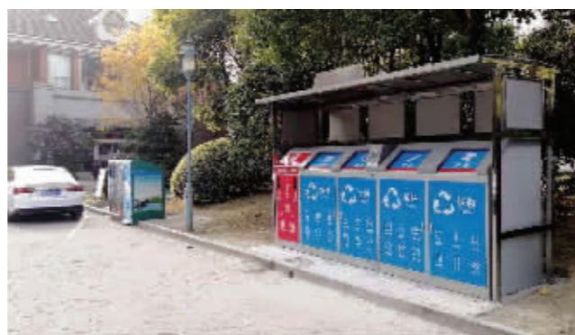
2019年全区完成新增155个小区垃圾分类信息化投放箱体建设

为实现新建公厕“布局科学、数量达标、标准统一、管理规范、服务优质、群众满意”的目标,2019年梁溪区按照“建筑特色化,设施标准化,环境生态化,功能人性化”的理念,紧扣强富美高新梁溪的要求,结合江南水乡的文化元素和民俗风情,全面完成新建公厕116座,推进梁溪区“厕所革命”向精细化和智能化发展。在客流量大的主干道、广场游园等重点区域,结合环卫驿站建设,提标改建了35座功能完善、环保先进、新颖美观、具有示范效应的一类环卫公厕。公厕做到一厕一景,设立第三卫生间,方便特殊对象如厕。同时增设了中央空调、新风和负离子空气净化系统,有效改善了公厕的空气质量。针对城区服务需求较高的53座公厕,主要改造完善公厕基本设施和功能,重点提高女性厕位比例,选用自动感应节水冲水装置,大量采用了太阳能电力系统,达到节能、干净、实用的要求,提升了日常使用的便捷性。结合游园、绿地、广场、步道系统和拆迁地块以及老居民区,在人流量大、建造公厕条件受限的区域,补充设置18座装配式公厕。实施“互联网+公厕”计划,提供手机App软件等,完善“智慧城管”公厕查询定位功能,提升市民找公厕用公厕的快捷性和有效性。