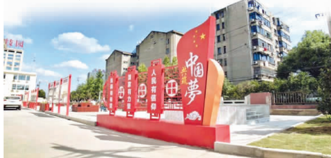
广益新村沿河废弃地周边面貌焕然一新

梁溪区作为无锡市的中心城区,全年建筑垃圾产生量大约30万吨,随着优美环境合格区建设的不断推进,全区建筑装修垃圾收集、消纳的压力骤增,“垃圾围城”现象日趋严峻。2018年下半年,无锡市国土储备中心将部分收储地块移交梁溪区管理后,梁溪区政府第一时间决定选取其中的原罗地亚工业园地块作为全区建筑垃圾的区级临时堆放、筛分以及资源化利用处置点,并通过政府采购服务的模式引进了上海良延环保科技有限公司,对梁溪