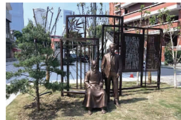
睦亲坊重要节点改造

合规范的店招广告进行整治外,还挖掘历史,提升内涵,增设历史文化名人雕塑,弘扬文化传统,打造了学前街名士雕塑群。改善居住环境,增进民生福祉,改造街边封闭绿地,打造景观节点,建设了睦亲坊、崇宁路微型游园。设置特色导向系统,串联周边丰富旅游资源。通过创新引领,多措并举,中心城区街巷环境明显改善,品质进一步提升。