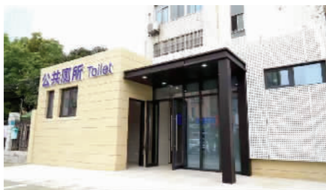
2019年“厕所革命”,改造升级116座公厕