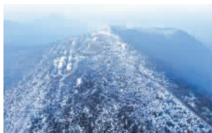
19日上午,雪后初霁,镇江句容市宝华山葱郁中点缀着片片白雪,雾气飘飘