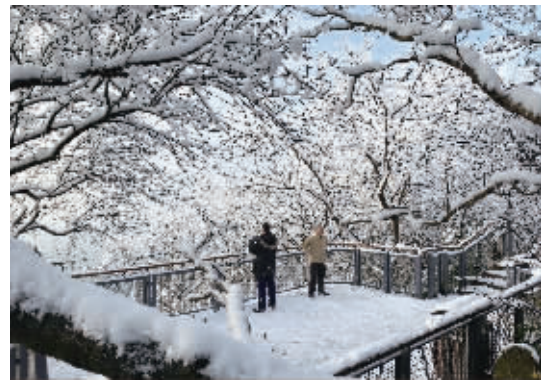
12月19日,紫金山头陀岭景区,经过一夜的飘雪,银装素裹