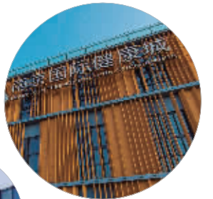
充满活力的江北新区