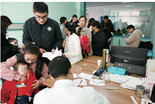
万延永总是坚持把所有的病人都看完再下班