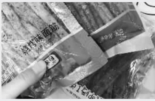
这三款都是“挤压糕点”