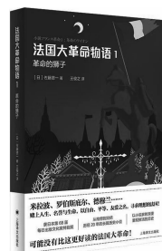
2019.10 上海译文出版社 [日]佐藤贤一 《法国大革命物语》