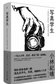
2019.11 理想国·广西师范大学出版社 [日]小林纪晴著 《写真学生》

在以寒冷的冬季、精密机械制造以及御柱祭著称的日本諏訪，一名叫做小林纪晴的高中生因为对摄影杂志饶有兴趣而立志成为了摄影师。后来他报考了位于东京的摄影学校，离开了家乡諏訪来到东京新宿。自此，崭新的生活开始了。对于小林来说，大都会的一切就好像泡沫一般不真实。