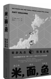
2019.10 理想国·广西师范大学出版社 [美]马特·古尔丁著 《米、面、鱼》

作者小林纪晴凭借《DAY ASIA》荣获日本摄影协会新人奖，他为家乡拍摄的一系列写真透明纯净，一直在中文世界被当成当代日系摄影的重要代表。《写真学生》是他唯一一部谈论自己学生时代求学摄影心路历程的自传性作品，也是国内第一次引进的小林作品。作者还为此特别挑选24幅彩色照片，作为赠品回馈给他的读者。