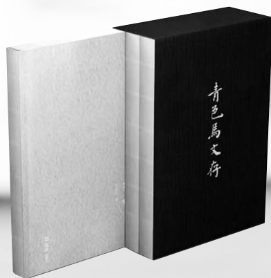
文汇出版社 2019年6月 《青色马文存》 王慧骐著