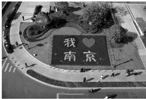
园林工人正在给鼓楼广场换冬装

快报讯 (见习记者 卢海燕)冷空气一波接着一波,鼓楼广场上两只“孔雀”已经迫不及待地换冬装了。12月6日,现代快报记者了解到,整体换装工作进入尾声,预计下周“孔雀”就能披上美丽的冬装啦!加上此前西侧绿地完工的“我爱南京”主题模纹花坛,鼓楼广场将以全新姿态迎接2020年,为南京打CALL!