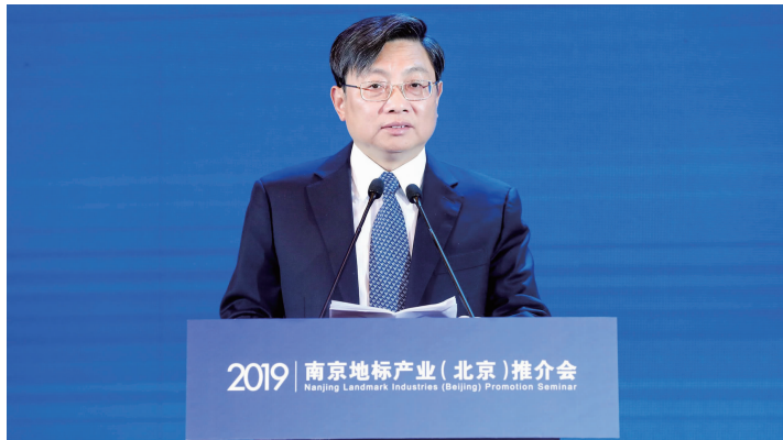
江苏省委常委、南京市委书记张敬华做主题推介