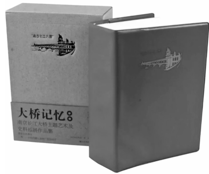
《大桥记忆》 江苏凤凰美术出版社 2019年1月