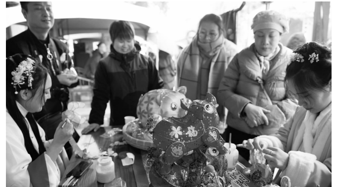
非遗展示吸引游客

快报讯(记者 刘静妍)在南京老城城南的街巷,你可能随时都会偶遇身穿汉服的小姐姐。11月30日下午,在老门东,小姐姐们提起了花灯,撑起了油纸伞……“抖in金陵 城市美好生活节”活动在这里拉开了序幕。