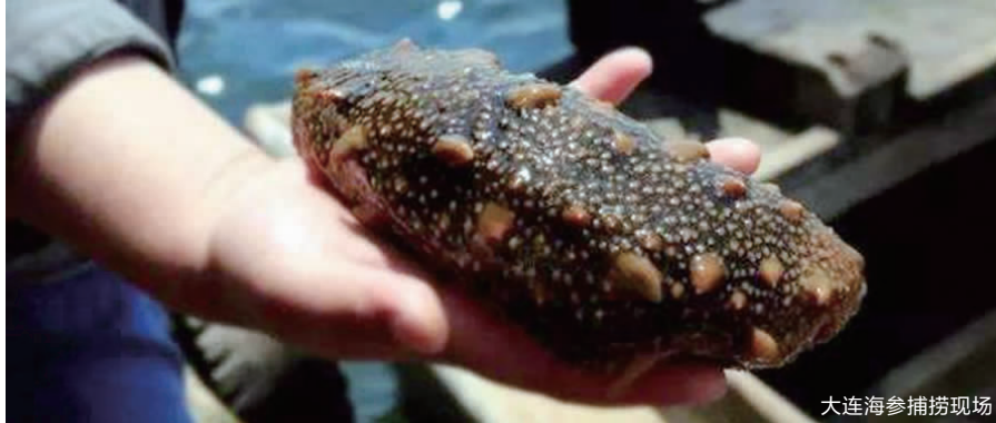
大连海参捕捞现场

据悉，本次活动优惠多多，大连淡干海参低至1980元/斤、马来西亚燕窝低至14元/克、加拿大进口西洋参0.78元/克起、正宗云南文山三七仅合140元/斤、西藏那曲整根虫草低至79元/克，每人限购50克、长白山野山参低至8元/克、雁荡山铁皮石斛低至1.9元/克、灵芝孢子粉1.9元/克起、野生天麻低至0.78元/克、紫丹参0.2元/克起、东阿县皇阿阿胶糕，499元/斤，买三斤送一斤，买五斤送两斤。