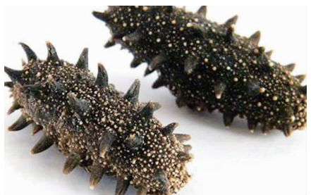
正宗大连淡干带刺海参