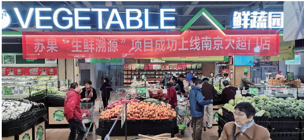
苏果“生鲜溯源”系统在市内48家中大型门店全面上线