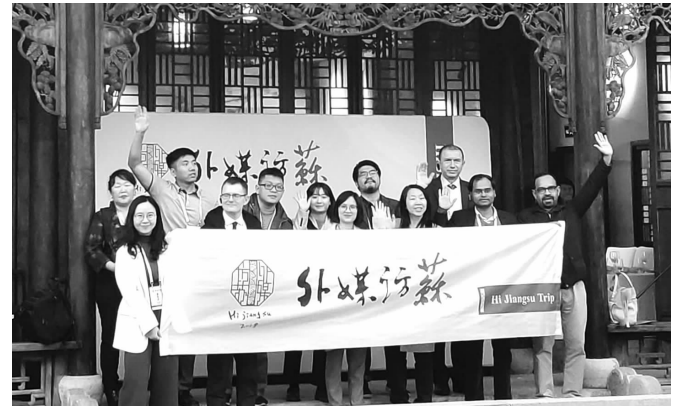
2019“Hi Jiangsu”外媒访苏团合影

2019“Hi Jiangsu”外媒访苏活动日前落下帷幕。11月26日,来自12个国家的15名外媒记者陆续踏上回国路。现代快报记者了解到,21日至25日,外媒记者走访了南京、扬州、南通三地,见证高质量发展的“大美江苏”。