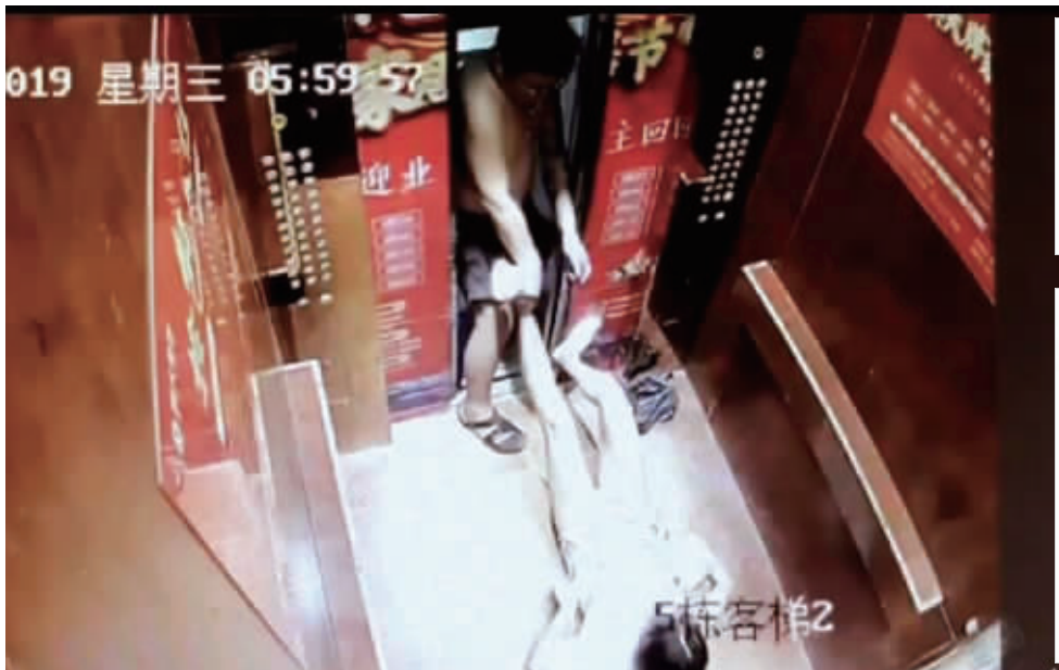
视频中宇芽遭拖拽的画面